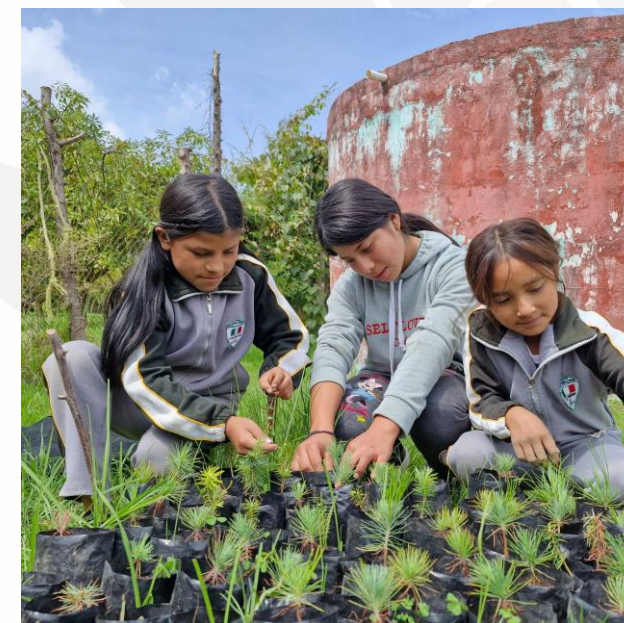
Seguimiento a viveros en la primaria "24 de febrero", C.I. Francisco Serrato, Zitácuaro Michoacán. Julio 2025